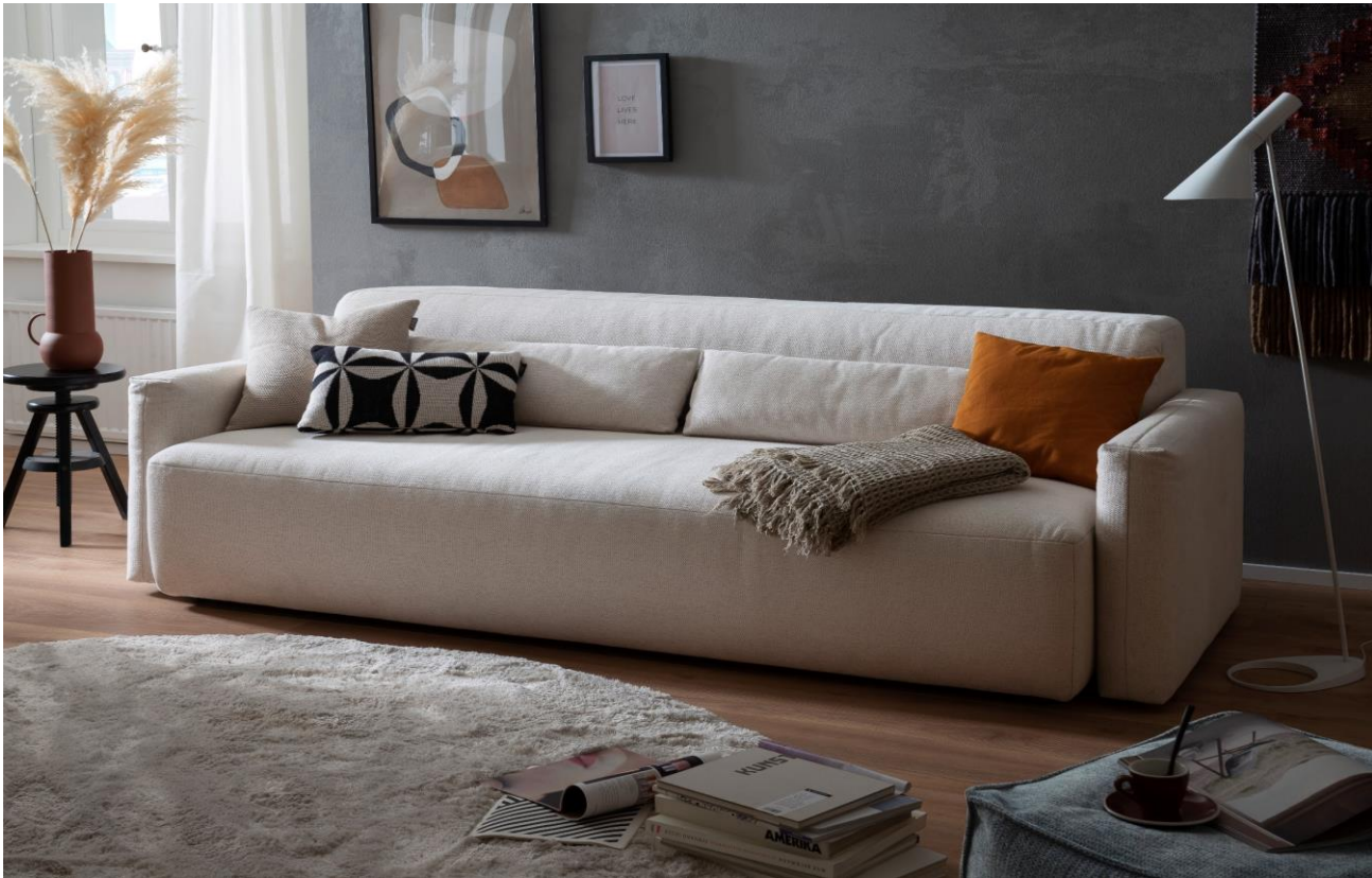
3-Sitzer mit 2 Armlehnen